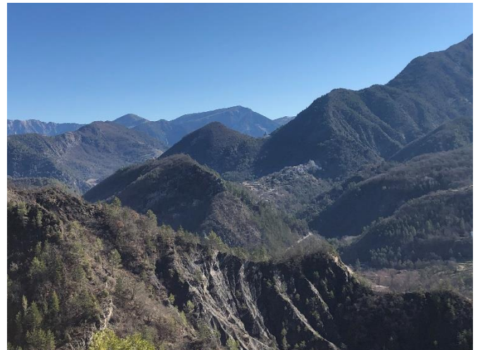
Vue sur la Vallée du Var

⇒ Retour à la Balise 55 avec Vue sur Villars