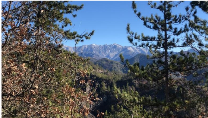
Vue sur le Brec d'Utelle

⇒ de la Balise 57 marcher sur la route 50mètres et bifurquer sur la droite à la Balise 56 et remonter au niveau du plateau du Cival avec Massoins et la Vallée de la Tinée et plonger en direction de la balise 55 avec vue sur la Vallée du Var, Village de Malaussène.